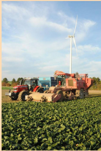
Après 10 tonnes de sucre à l'hectare, les rendements sur les surfaces de Cristal Union ont été inférieurs de 30 % à la normale.

Est, en millions d'euros, le résultat net de Cristal Union en 2020/2021. Lors de l'exercice précédent, le coopératif avait déclaré un résultat négatif de 89 millions d'euros.